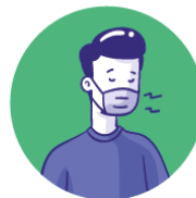
Usar mascarillas y guantes