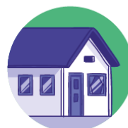
Quedarse en casa