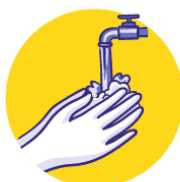
Lavar las manos 10 veces