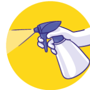
Desinfectar las superficies