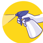
Desinfectar las superficies